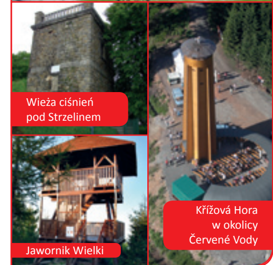
Wieża ciśnię pod Strzelinem