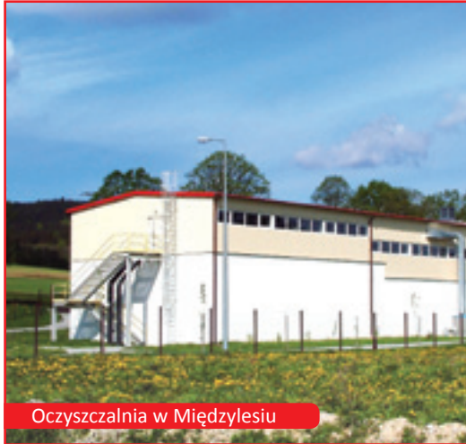
Oczyszczalnia w Międzyzylesiu