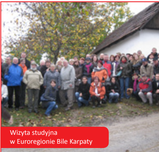
Wizyta studyjna w Euroregionie Bile Karpaty

stowarzyszenia miast i gmin „Euroregion Pogranicza Czech, Moraw i Ziemi Kłodzkiej – Euroregion Glacensis”, który powstał na podstawie Umowy o utworzeniu czesko-polskiego Euroregionu Pogranicza Czech, Moraw i Ziemi Kłodzkiej – Euroregionu Glacensis.