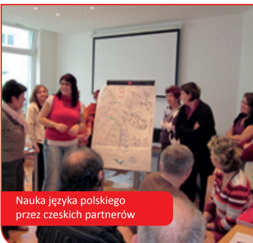
Nauka języka polskiego przez czeskich partnerów