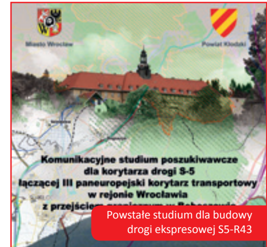
Powstałe studium dla budowy drogi ekspresowej S5-R43