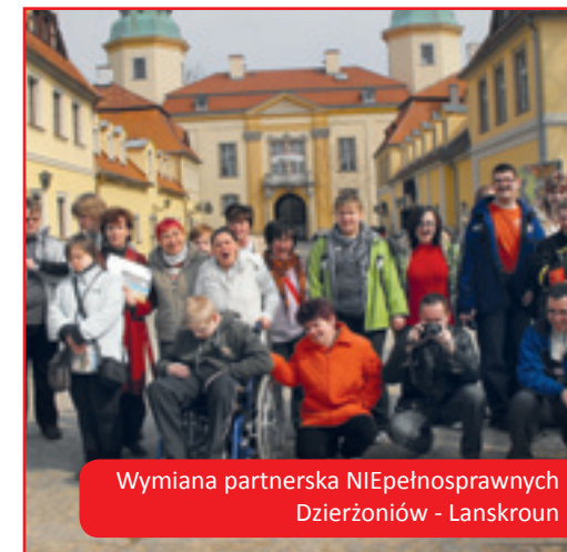
Wymiana partnerska NIEpełnosprawnych Dzierżoniów - Lanskroun

Obie strony mają dostęp do informacji dotyczących dysponowania funduszami Euroregionu.