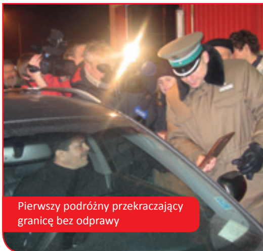
Pierwszy podróżny przekraczający granicę bez odprawy