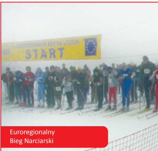
Euroregionalny Bieg Narciarski