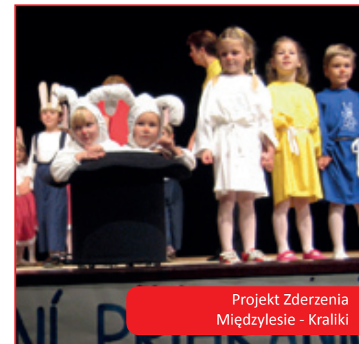
Projekt Zderzenia Międzyzlesie - Kraliki

W dniu 17 marca 2000 roku w Długopolu Dolnym z inicjatywy Stowarzyszenia Gmin Ziemi Kłodzkiej utworzono Stowarzyszenie Gmin Polskich Euroregionu Glacensis, które zostało zarejestrowane przez Sąd Okręgowy w Świdnicy jako nowy polski partner w Euroregionie. Powołanie nowego Stowarzyszenia było spowodowane koniecznością wzajemnego dostosowania struktur euroregionalnych po obu stronach