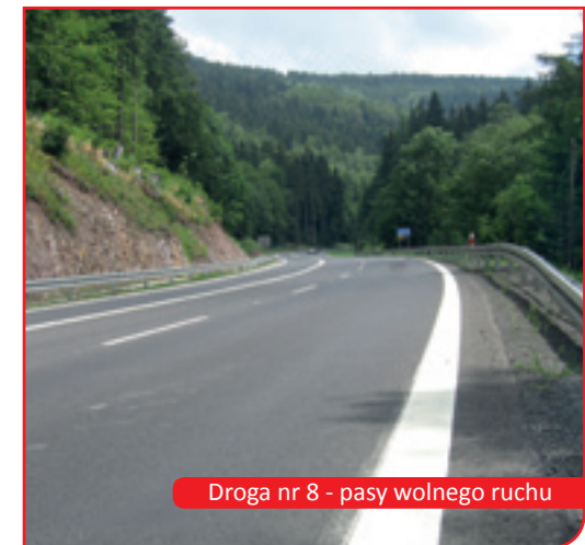
Droga nr 8 - pasy wolnego ruchu