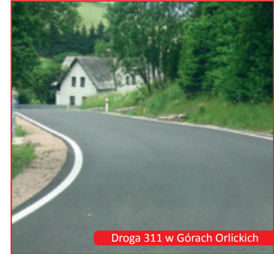
Droga 311 w Górach Orlickich