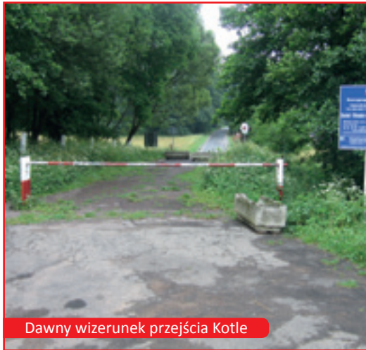
Dawny wizerunek przejścia Kotle