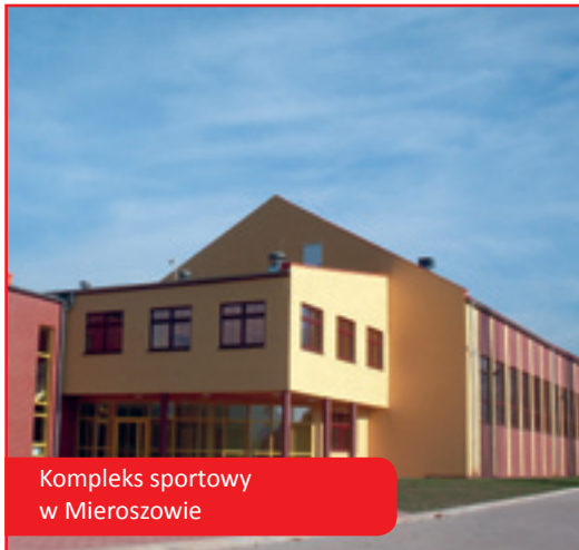
Kompleks sportowy w Mieroszowie