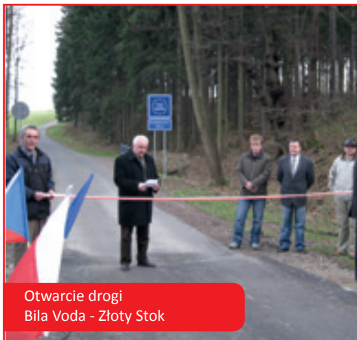
Otwarcie drogi Biła Voda - Złoty Stok