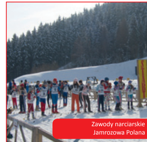
Zawody narciarskie Jamrozowa Polana