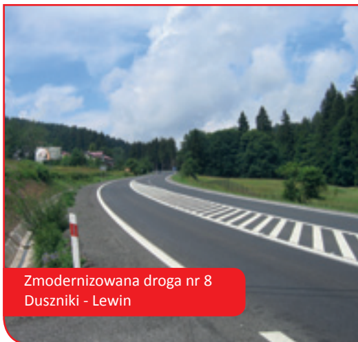
Zmodernizowana droga nr 8 Duszniki - Lewin

Choć zapewniony został instrument finansowy dla wsparcia transgranicznych inicjatyw z jednej strony, z drugiej ciężar utrzymywania bieżących kontaktów został przerzucony na samorządy członkowskie, a stowarzyszenie wspierając je finansowo i realizując własne inicjatywy dla całego obszaru wsparcia, postawiło największy nacisk i zaangażowało się wdrażaniu programów pomocowych UE ukierunkowanych na współpracę transgraniczną.