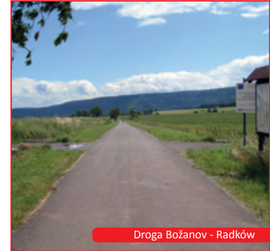
Droga Božanov - Radków

Kolejnym etapem było uruchomienie na pograniczu programu Phare Cross border co-operation (CBC). Funduszu Małych Projektów, którym Euroregion na własnym obszarze zarządzał służył realizacji małych projektów (tzw. „miękkich”) dotyczących sfery społecznej (np. inicjatyw kulturalnych, sportowych, naukowych). W tym procesie od początku pomagała Euroregionowi jednostka wdrażająca program – Władza Wdrażająca Program Współpracy Transgranicznej Phare Ministerstwa Spraw Wewnętrznych i Administracji oraz Ministerstwo Rozwoju Regionalnego RCZ. Program Phare CBC na pograniczu polsko-czeskim uruchomiono w 1999 roku a jego realizacja trwała do 2006 roku. Dzięki realizacji kilku transz programu i obsługi 181 projektów, uzyskaliśmy niezbędne doświadczenie wraz z beneficjentami pod kątem nowych inicjatyw. Wzmocniliśmy się również instytucjonalnie.