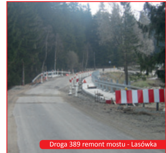
Droga 389 remont mostu - Lasówka