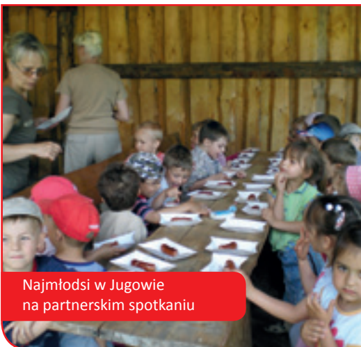
Najmłodzi w Jugowie na partnerskim spotkaniu