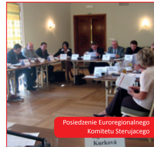
Posiedzenie Euroregionalnego Komitetu Sterującego