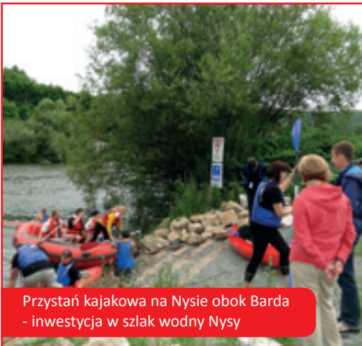
Przystań kajakowa na Nysie obok Barda - inwestycja w szlak wodny Nysy