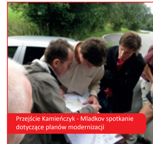
Przejście Kamieńczyk - Mladkov spotkanie dotyczące planów modernizacji