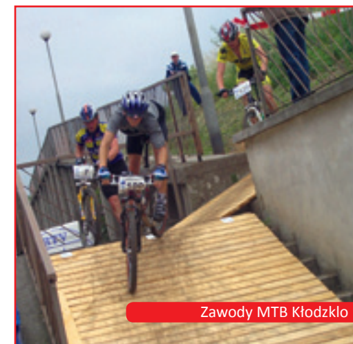
Zawody MTB Kłodzko