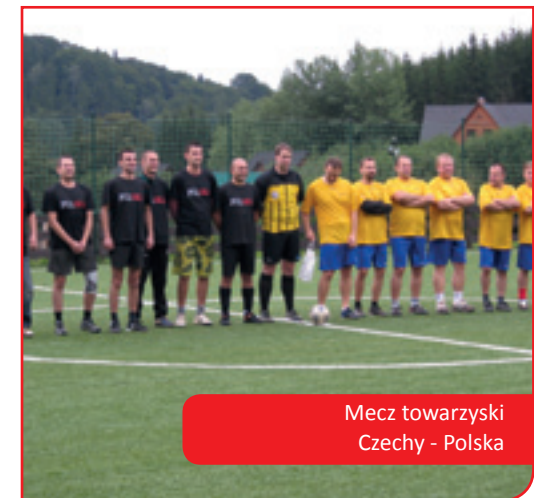
Mecz towarzyski Czechy - Polska