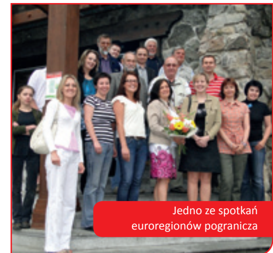
Jedno ze spotkań euroregionów pogranicza