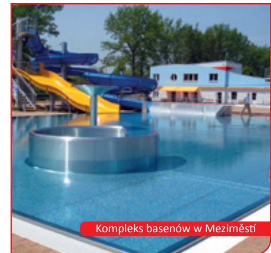
Kompleks basenów w Meziměstí