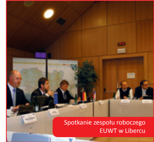
Spotkanie zespołu roboczego EUWT w Libercu

• Szukanie nowych zewnętrznych źródeł finansowania związanych z formułą EUWT.