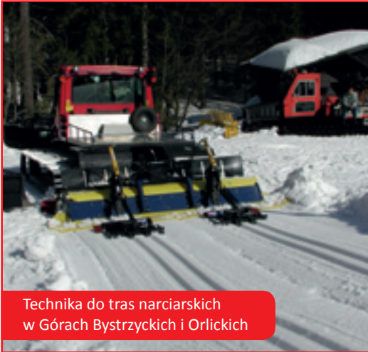
Technika do tras narciarskich w Górach Bystrzyckich i Orlickich

na pograniczu. Ten nowy – najbardziej trans graniczny mechanizm pragniemy zbudować w taki sposób, aby jak najefektywniej osiągać cele rozwojowe pogranicza w oparciu o doświadczenie samorządów i instytucji pogranicza oraz potencjał tkwiący e europejskich regionach.