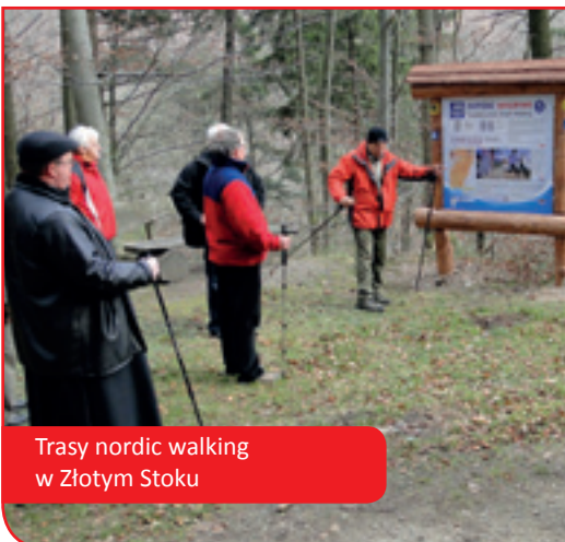
Trasy nordic walking w Złotym Stoku