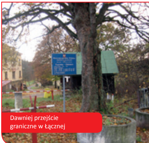
Dawniej przejście graniczne w Łącznej