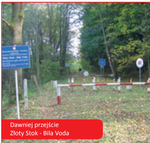
Dawniej przejście Złoty Stok - Biła Voda