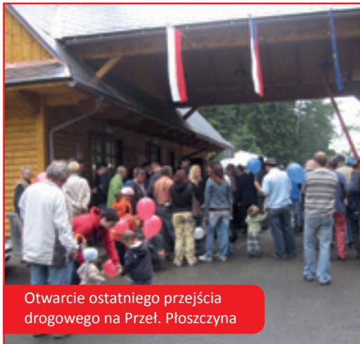
Otwarcie ostatniego przejścia drogowego na Przel. Płoszczyna