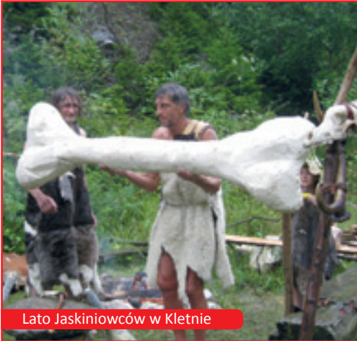
Lato Jaskiniowców w Kletnie

■ ■ ■ ■ ■ Pierwszy budżet polskiej części euro-regionu w 1996 roku w pozycji dochody wynosi 21033,16 zł. Rekordowe dochody budżetu polskiej części euroregionu w 2010 roku wyniosły 6 082 593,56 zł.