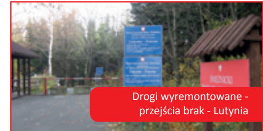
Drogi wyremontowane - przejścia brak - Lutynia

W związku ze zbliżającym się nowym okresem programowania 2014 -2020 i nowym instrumentem na rynku instytucji jakim jest Europejskie Ugrupowanie Współpracy Terytorialnej od 2008 roku zaczęto rozważać powołanie ugrupowania. Od rozmów w formule euroregionów Glacensis i Nysa w marcu 2009 roku do pierwszego spotkania potencjalnych założycieli EUWT – euroregionów Glacensis i Nysa, Woj. Dolnośląskiego, krajów: Kralovohradeckiego, Libereckiego, Ołomunieckiego i Pardubickiego 26 sierpnia 2010 roku we Wrocławiu, poprzez wiele spotkań, warsztatów i konferencji, określiliśmy cele wyjściowe EUWT oraz przystąpiliśmy wszyscy do opracowania strategii współpracy