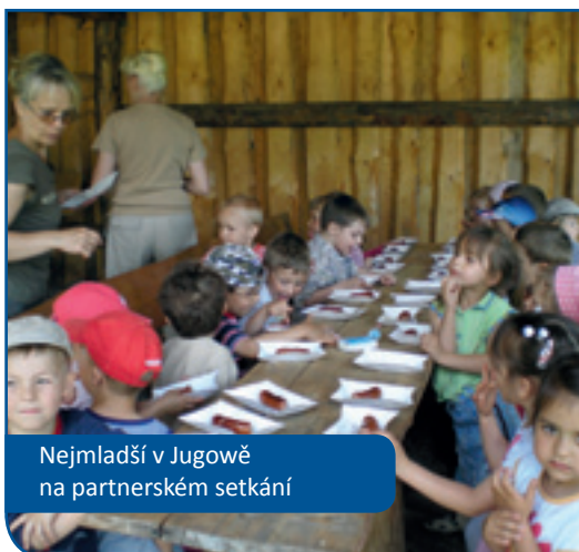
Nejmladší v Jugowě na partnerském setkání