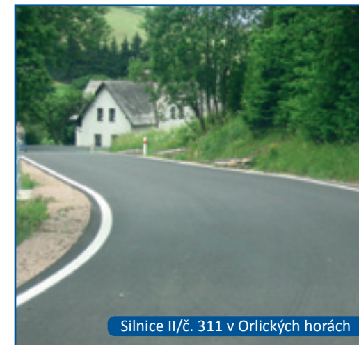
Silnice II/č. 311 v Orlických horách

*** program v realizaci – údaje v 18 projektech se týkají dílčích rozpočtů projektů, na kterých se podílí partneři z území euroregionu, společně s partnery z jiných částí příhraničí