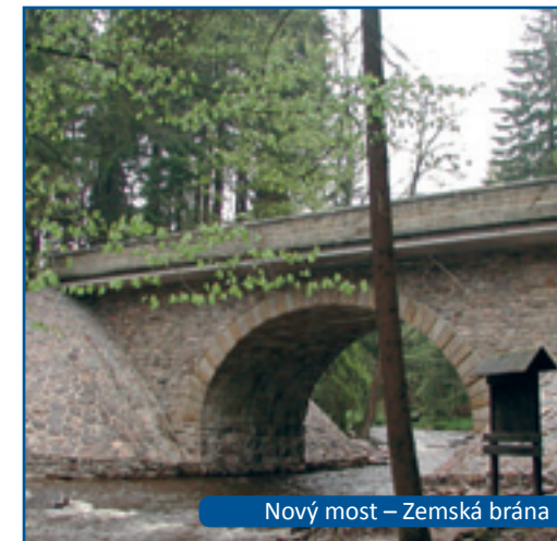
Nový most – Zemská brána