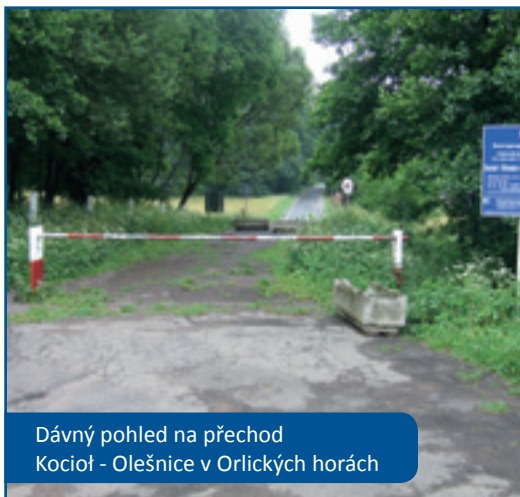
Dávný pohled na přechod Kocioł - Olešnice v Orlických horách