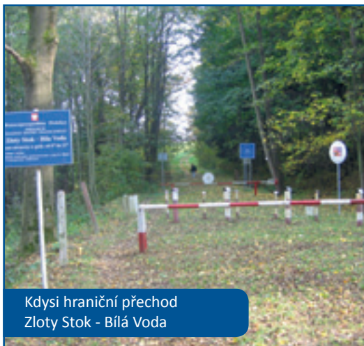
Kdysi hraniční přechod Złoty Stok - Bílá Voda