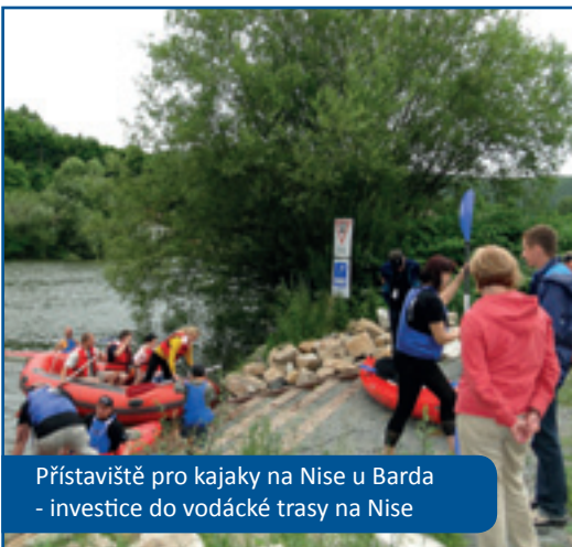
Přístaviště pro kajaky na Nise u Barda - investice do vodácké trasy na Nise