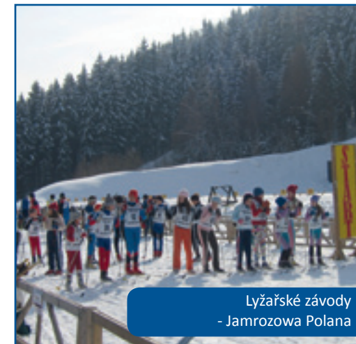
Lyžařské závody - Jamrozowa Polana