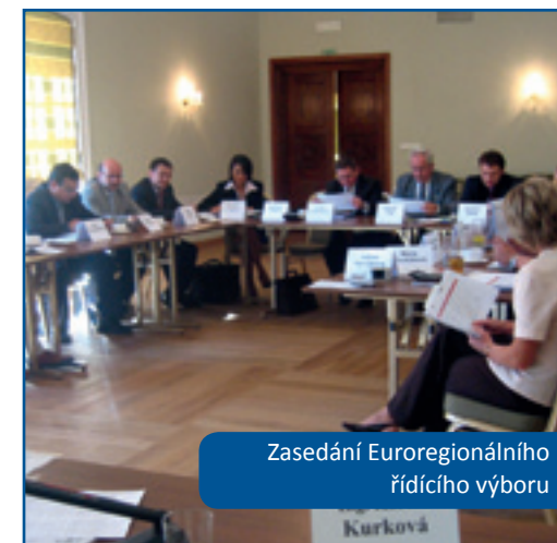
Zasedání Euroregionálního řídícího výboru