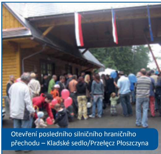
Otevření posledního silničního hraničního přechodu – Kladské sedlo/Przełęcz Płoszczyna