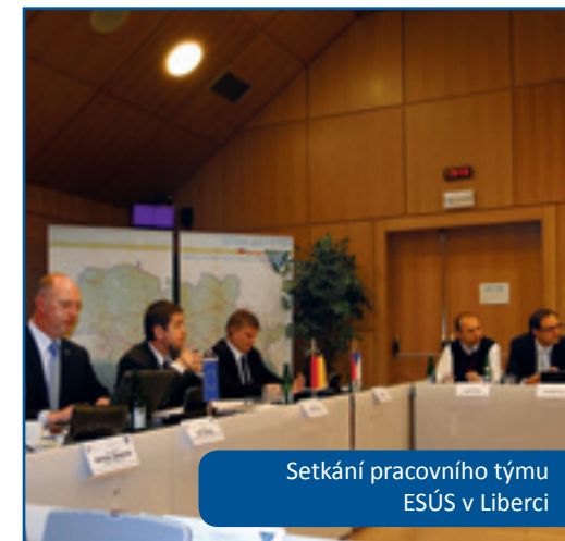
Setkání pracovního týmu ESÚS v Liberci