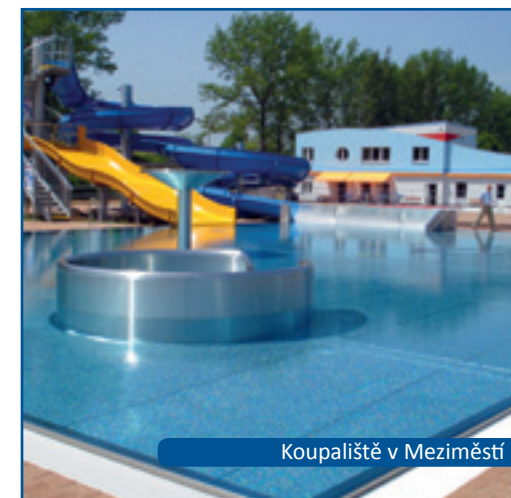
Koupaliště v Meziměstí