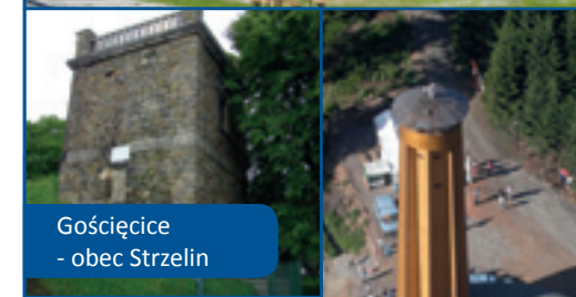
Gościęcice - obec Strzelin