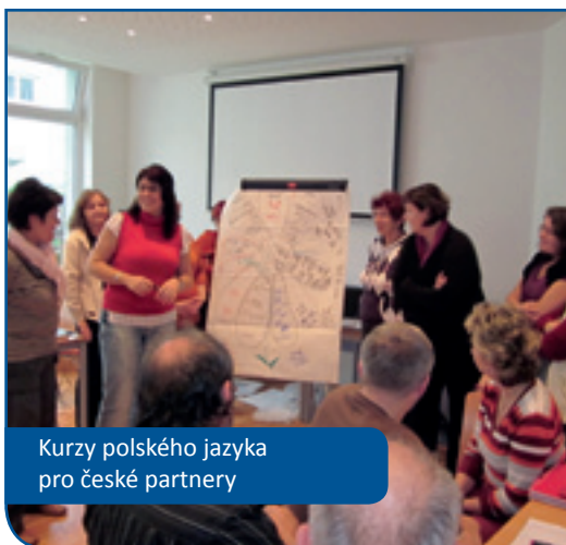
Kurzy polského jazyka pro české partnery