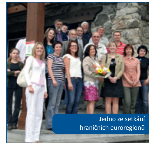
Jedno ze setkání hraničních euroregionů