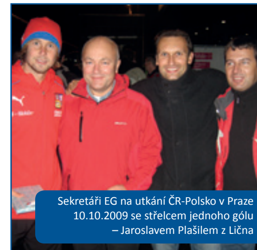
Sekretáři EG na utkání ČR-Polsko v Praze 10.10.2009 se střelcem jednoho gólu – Jaroslavem Plašilem z Lična

■ ■ ■ ■ ■ Komise a pracovní skupiny zpracovávají podklady formou žádostí a doporučení a následně předkládají Radě, která je schvaluje a dohlíží na realizaci. Skupiny vznikají nebo zanikají na základě usnesení Rady euroregionu. Pracovní skupiny pracují na principu dobrovolnosti a jejich členy jsou osoby, jejichž pracovní náplň se překrývá s oblastí činnosti pracovní skupiny. Počet členů, odborná struktura a personální složení jsou interní záležitostí každé strany euroregionu. V rámci struktur euroregionu působí Komise pro výzkum a regionální vzdělávání. ■ ■ ■ ■ ■