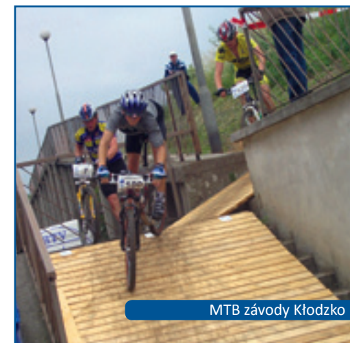
MTB závody Klodzko