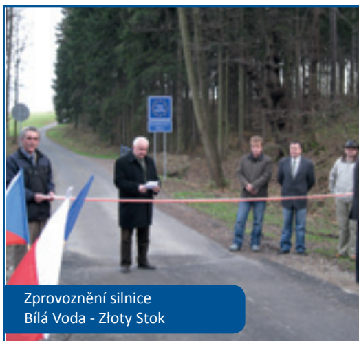
Zprovoznění silnice Bílá Voda - Złoty Stok