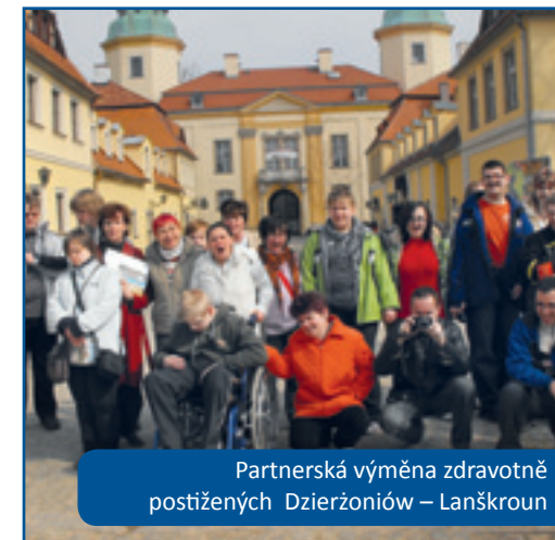
Partnerská výměna zdravotně postižených Dzierżoniów – Lanškroun