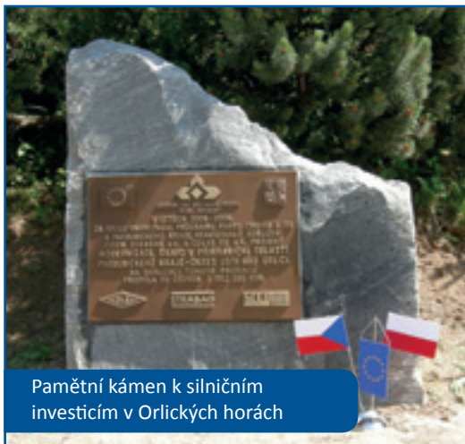
Pamětní kámen k silničním investicím v Orlických horách

Rozloha euroregionu činí přibližně 4900 km 2 , žije zde přes 1 mil. obyvatel. Jeho významnou část zaujímají horská pásma středních a východních Sudet a jejich podhůří. Téměř na celém území Euroregionu se nachází přírodně a krajinně zajímavé oblasti, které přispívají k rozvoji cestovního ruchu.