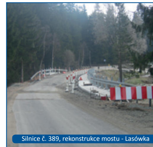
Silnice č. 389, rekonstrukce mostu - Lasówka