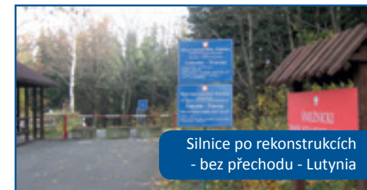
Silnice po rekonstrukci - bez přechodu - Lutynia

V souladu s blížícím se novým programovacím obdobím 2014 -2020 a novým nástrojem na trhu institucí, kterým je Evropské seskupení pro územní spolupráci, je od roku 2008 zvažováno založení takového seskupení. Od prvních jednání v rámci euroregionů Glacensis a Nisa v březnu 2009 do první schůzky potenciálních zakladatelů ESÚS – euroregionů Glacensis a Nisa, Dolnoslezského vojvodství, krajů: Královéhradeckého, Libereckého, Olomouckého a Pardubického dne 26. srpna 2010 ve Vratislavi, přes řadu jednání, workshopů a konferencí, jsme stanovili výchozí cíle ESÚS a přistoupili jsme ke zpracování strategie spolupráce v příhraniční oblasti. Tento nový – nejvíce přeshraniční mechanismus chceme vybudovat tak, abychom co neefektivněji naplňovali rozvojové cíle příhraničního území při využití zkušeností samospráv a institucí z tohoto území a potenciálu evropských regionů.