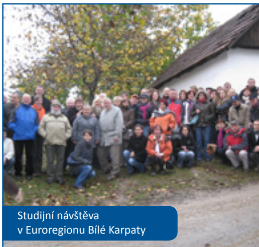
Studijní návštěva v Euroregionu Bílé Karpaty