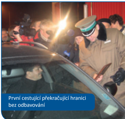
První cestující překračující hranici bez odbavování