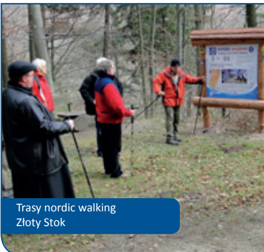
Trasy nordic walking Złoty Stok

Bariéry spolupráce , které omezují rozvoj česko-polské spolupráce na území euroregionu, jsou následující: