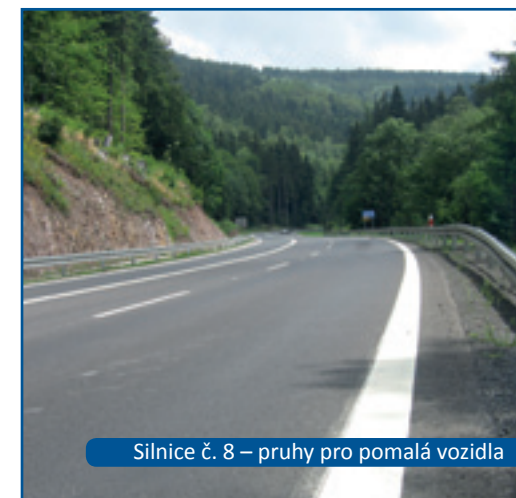
Silnice č. 8 – pruhy pro pomalá vozidla