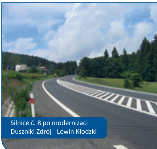
Silnice č. 8 po modernizaci Duszyniki Zdrój - Lewin Kłodzki

zkušenosti pro nové iniciativy. Posílili jsme se i institucionálně. Na jedné straně byl zajištěn finanční nástroj pro podporu přeshraničních iniciativ, ale na druhé straně byla podstata udržování průběžných kontaktů přenesena na členské samosprávy. Sdružení je finančně podporováno a realizovalo vlastní iniciativy zaměřené na celé podporované území, zároveň kladlo největší důraz a angažovanost na implementaci dotačních programů EU zaměřených na přeshraniční spolupráci.