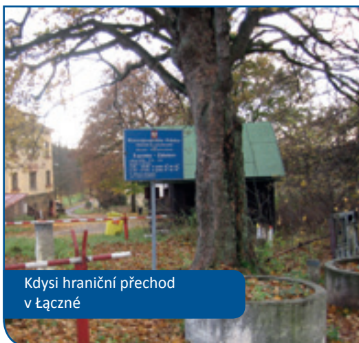
Kdysi hraniční přechod v Łączné