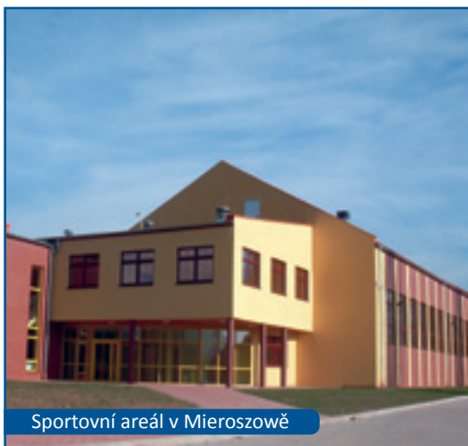
Sportovní areál v Mieroszowě