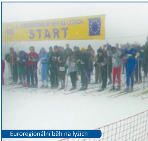
Euroregionální běh na lyžích