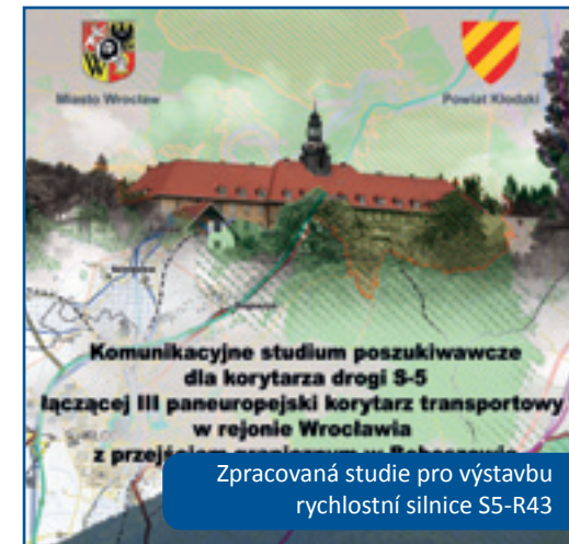
Zpracovaná studie pro výstavbu rychlostní silnice S5-R43