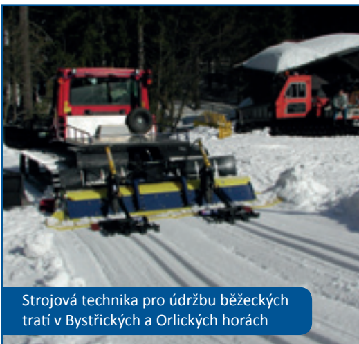
Strojová technika pro údržbu běžeckých tratí v Bystřických a Orlických horách