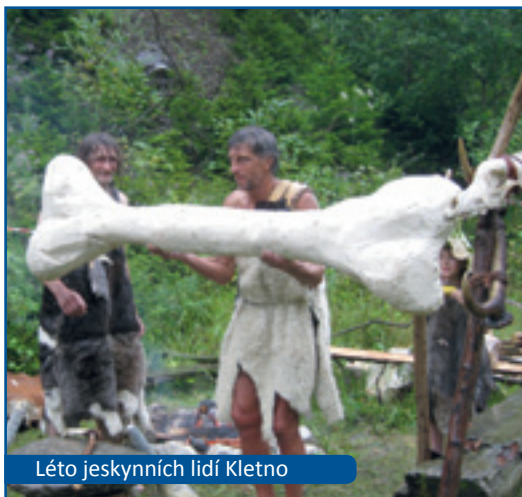
Léto jeskynních lidí Kletno

■ ■ ■ ■ ■ První rozpočet polské části euro-regionu v roce 1996 činil v položce příjmů 21 033,16 PLN. Rekordní příjmy v rozpočtu polské části euroregionu v roce 2010 činily 6 082 593,56 PLN.