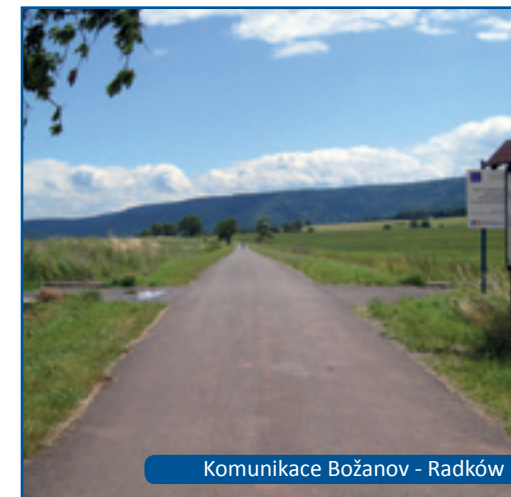
Komunikace Božanov - Radków

Další etapou bylo vyhlášení v příhraničním území programu Phare Cross border co-operation (CBC). Fond malých projektů, který euroregion na svém území spravoval, byl zaměřený na realizaci malých projektů (tzv. „měkkých“), týkajících se společenské sféry (např. kulturní, sportovní, vědecké iniciativy). V tomto procesu od začátku euroregionu pomáhala implementační složka programu – Implementační orgán pro program přeshraniční spolupráce Phare Ministerstva vnitra a administrativy PR a Ministerstvo pro místní rozvoj ČR. Program Phare CBC byl v česko-polském příhraničí vyhlášen v roce 1999 a jeho realizace probíhala do roku 2006. Díky realizaci několika kol programu a obsluze 181 projektů jsme získali společně s příjemci nezbytné