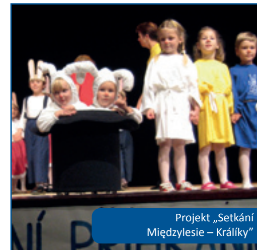
Projekt „Setkání Międzyzlesie – Králiky“

Dne 17. března 2000 v Długopole Dolne z iniciativy Sdružení obcí Kladského pomezí (Stowarzyszenia Gmin Ziemi Kłodzkiej) vzniklo Sdružení polských obcí Euroregionu Glacensis (Stowarzyszenie Gmin Polskich Euroregionu Glacensis), registrované Oblastním soudem ve Świdnici jako nový polský part-