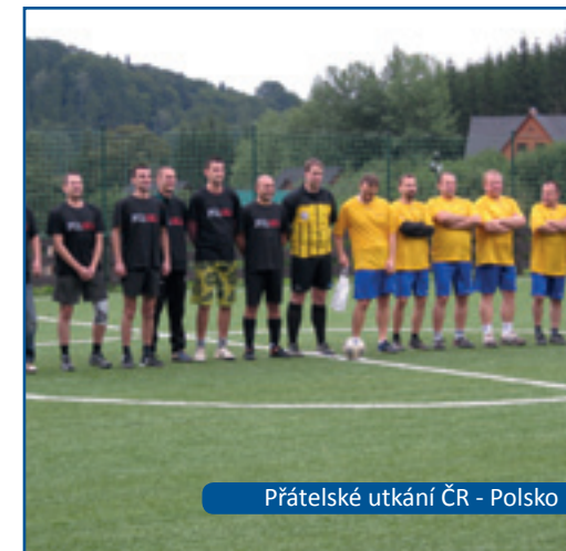
Přátelské utkání ČR - Polsko