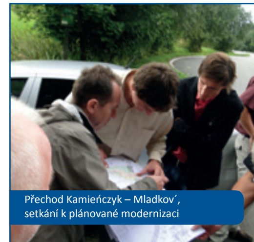
Přechod Kamieńczyk – Mladkov, setkání k plánované modernizaci