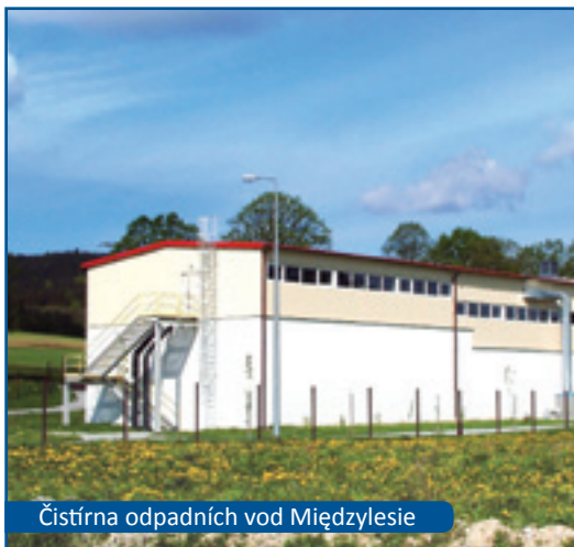
Čistírna odpadních vod Międzylesie